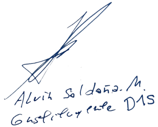
6. Alvin Saldaña