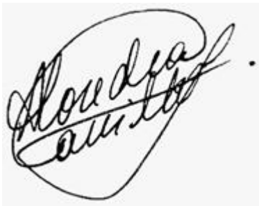
5. Alondra Carrillo