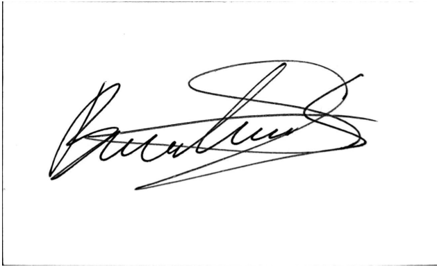
4. Bastián Labbé Salazar