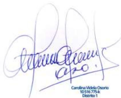
Carolina Videla Osorio Convencional Constituyente Distrito 1