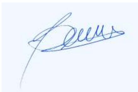
Bárbara Sepúlveda Hales Convencional Constituyente Distrito 9