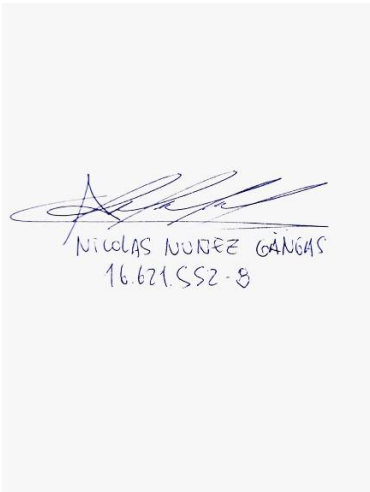
Nicolás Nuñez Gangas Convencional Constituyente Distrito 16