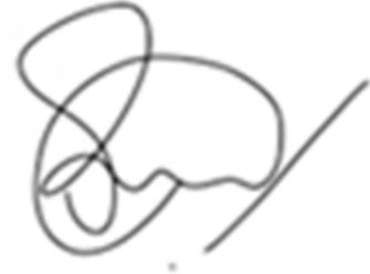
Pedro Muñoz Leiva Convencional Constituyente Distrito 24